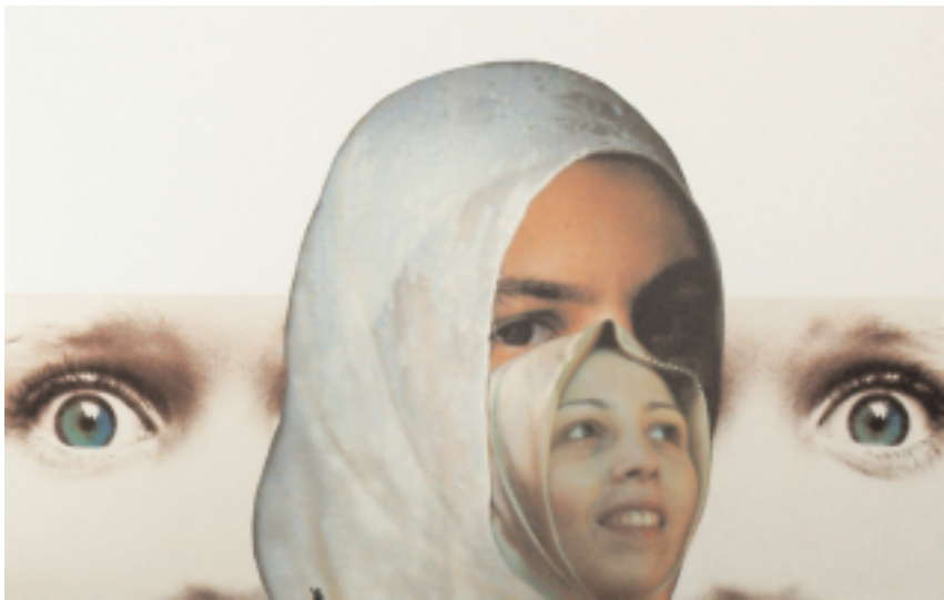
illustration de l'auteur : extrait